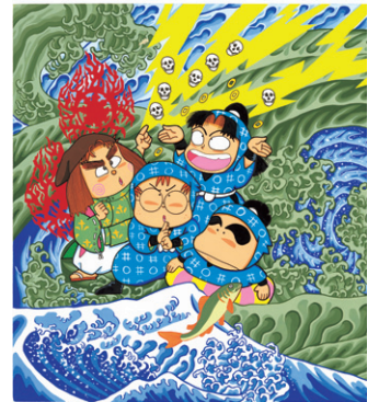
『にんたま、げんたま げんじゅつくらべ!?!』

1991年にポプラ社から出版された児童向けの絵本。忍者のたまご「乱太郎」「きり丸」「しんべい」の3人が、正義感いっぱい、どんな困難にも自分たちの力で立ち向かう姿に共感できるシリーズ。