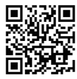
© 尼子騒兵衛 / NHK・NEP © ミュージカル「忍たま乱太郎」製作委員会