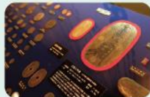
コインミュージアムに展示されている江戸時代最後の万延大判金。

尼崎藩主に関する資料や世界170カ国のコインを展示する尼信会館。特に最後の藩主をつとめた櫻井松平家ゆかりの歴史的資料は見ごたえ抜群!