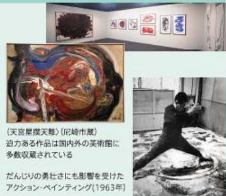
(天宮星撲天鵝)(尼崎市蔵) 迫力ある作品は国内外の美術館に多数収蔵されている

📍 尼崎市昭和通2-7-16 (尼崎市総合文化センター4F) TEL.06-6487-0206 🕒 10:00~17:00(最終入場 16:30) 🚗 火車/年末年始、展示替期間 🎫 観覧料:一般200円、シニア100円、高校生・大学生100円、中学生以下 無料