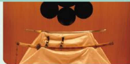
鎌倉時代中期の備前島田の刀匠、初代守家作の太刀。鑑定書「本阿弥光温墨書」が添えられており、真正正銘の「折り紙つきの逸品」。

📍 尼崎市東桜木町3 TEL.06-6413-1121 🕒 10:00~16:00 🚗 月曜、祝休日(土曜・日曜と重なる場合は閉館)、12月29日~1月5日 🎫 入館料:無料