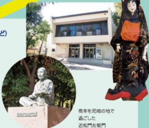
晩年を尼崎の地で過ごした近松門左衛門

📍 尼崎市久々第1-4-32 TEL.06-6491-7555 🕒 10:00~16:00 🚗 水曜・第2日・お盆(8/13~8/16)・年末年始(12/29~1/7) 🎫 入館料:大人200円、学生150円、子ども100円