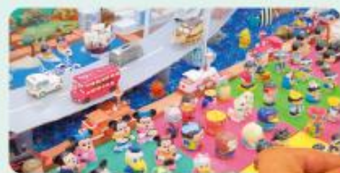
「タマニーバンク」貯金箱。役人の懐にゆっくりとコインが落ちていきます。コインが懐に入るとゆっくりと「らんらん」と聞こえ役人。

📍 尼崎市西本町北通3丁目93 TEL.06-6413-1163 🕒 10:00~16:00 🚗 月曜、祝休日(土曜・日曜と重なる場合は閉館)、12月29日~1月5日 🎫 入館料:無料