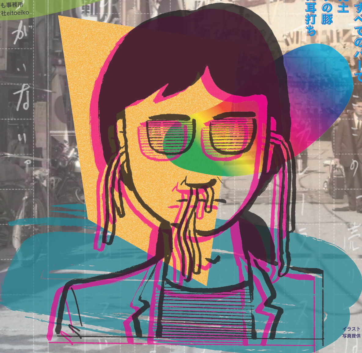
イラスト 中島らも事務所 ※モノクロ写真に着色

出展原稿 僕に踏まれた町と僕が踏まれた町 今夜、すべてのパーで 西方元土 ガダラの豚 ロバに耳打ち ロカ